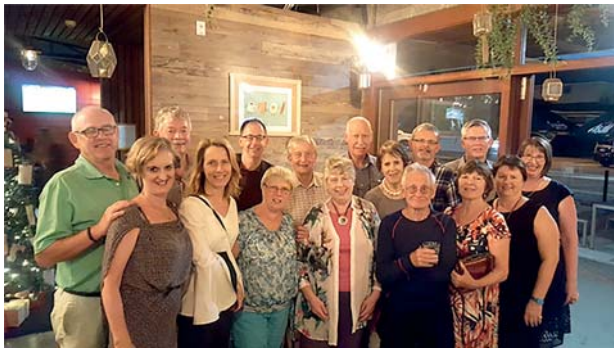
Équipes a Wellington, 2016.