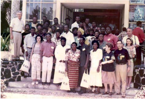
Delegazione del Togo alla Sessione di Formazione con alcuni membri dell'ERI. Luglio 1997.

Grazie al dinamismo e alla determinazione delle équipes togolesi, le END sono nate in Benin nel 1997, in Costa d'Avorio nel 2008 e in Guinea nel 2013. Il Togo, vera locomotiva della regione marittima occidentale, si vanta di essere tra i pionieri del Movimento nei paesi citati.