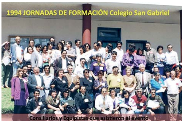
Ecuador. Giornata di Formazione. Collegio San Gabriel di Quito, 1994.