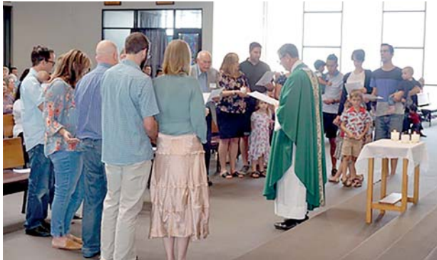
Messa di Benvenuto per le équipes di Hamilton, 2019.

Le coppie protagoniste di ciascuna delle tre città hanno formato la prima Equipe di Settore in questa nuova fase del Movimento in Nuova Zelanda. Nel 2019 hanno partecipato a un Ritiro di Formazione in Australia per vivere più profondamente il Movimento delle Équipes Notre-Dame.