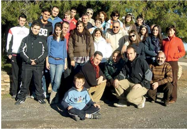
Équipe Almagro 2, regione Centro, Super-Regione Spagna.