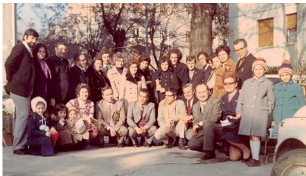
Prima équipe di Pescara 1970.