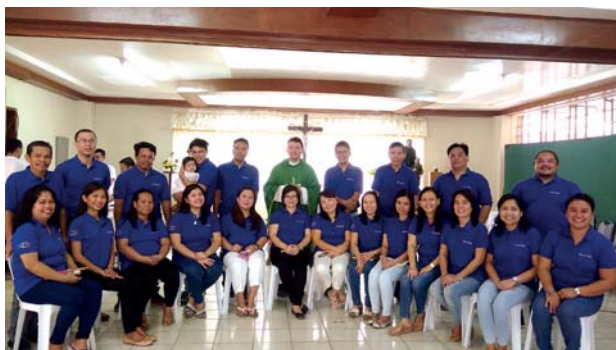
Settore Cebu Équippers con il CS.

Durante questo periodo, le équipes hanno sviluppato legami più stretti con la comunità locale dei Padri Scolopi e sono state coinvolte nelle regolari messe domenicali, durante le cerimonie speciali per le vacanze e i grandi eventi, come l'ordinazione di nuovi sacerdoti. Allo stesso tempo, i Padri Scolopi hanno continuato a sostenere il Settore di Cebu come hanno sempre fatto, e hanno partecipato anche alcuni diaconi come Consiglieri Spirituali delle Équipes di Settore e delle singole équipes.