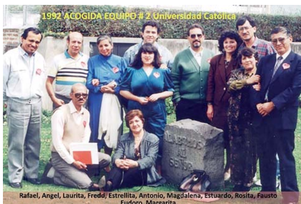
Ecuador. Équipe No. 2 di Quito, 1992.

Dopo una giornata di formazione a Bogotá, a cui sono state invitate coppie dell'équipe Quito1 e del loro CS nel 1991, si è formata l'équipe 2 con le coppie legate al Don Bosco Technical College e nel 1992 sono state inte-