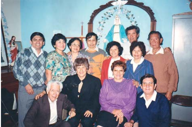
Équipe No. 1 di Chimbote.