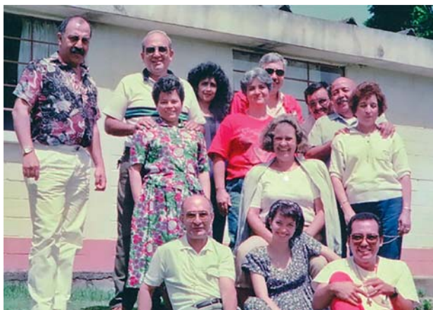
La prima équipe END in Guatemala.