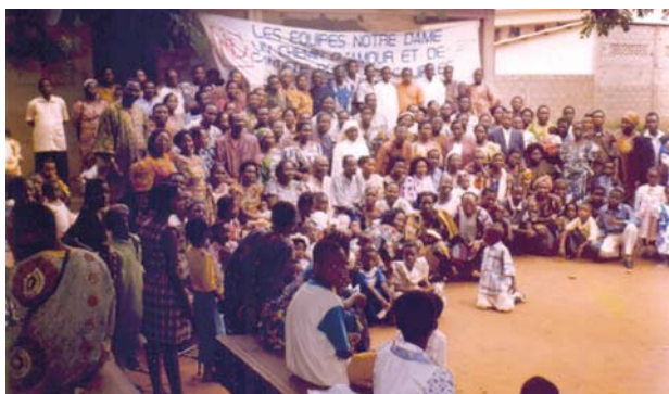
Anniversario dei 15 anni delle END nel Togo – Lomé, Luglio 2000.