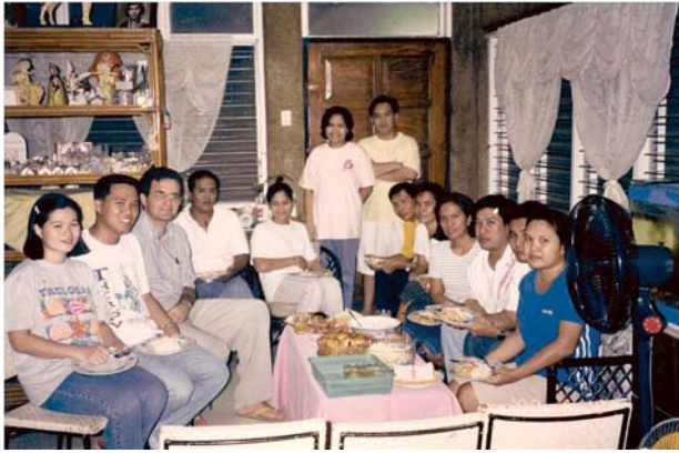
Riunione della prima équipe a Cebu.

La prima équipe è stata creata nel 2000 con coppie che vivevano e lavoravano localmente nella comunità in cui si trova la Casa de Formación Escolar, in Guadalupe, nella città di Cebu. Casualmente, le END iniziano sull'isola di Cebu, dove il cristianesimo è stato introdotto per la prima volta nelle Filippine, nell'anno 1565.