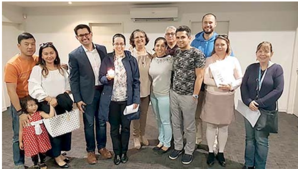
Équipe 1 di Auckland, 2019.