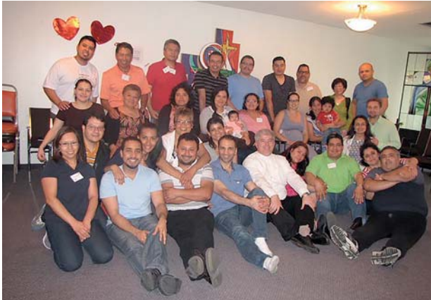
Winnipeg. Partecipanti al primo ritiro annuale. 2016.

Recentemente, a braccia aperte e con grande solidarietà, il Canada accoglie un gruppo di coppie siriane nella provincia del Québec. Queste coppie che partecipavano nelle Équipes in Siria oggi continuano il loro cammino nella città di Montréal. È la prima équipe di lingua araba in Canada