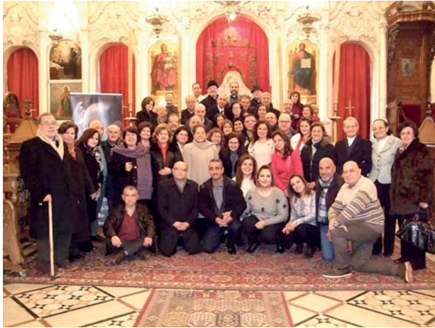
Siria 2019. Membri delle END.