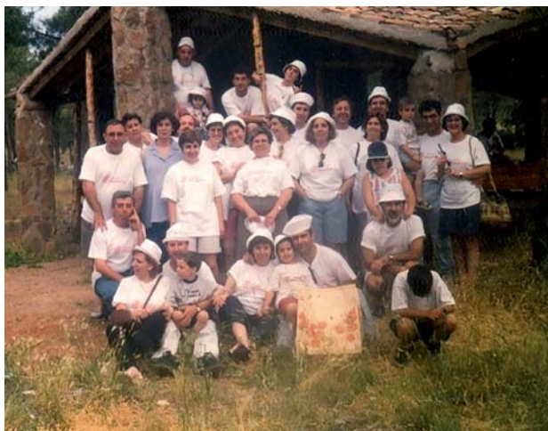
Settore Illescas. Inizio delle équipes Santa Cruz 1 e 2.

Il Movimento inizia così la sua rapida diffusione in tutta la Spagna. In soli cinque anni, le équipes in Spagna si sono moltiplicate per 6. Nell'anno accademico 64-65 ci sono già 277 équipes, distribuite in tre regioni: Barcellona (include la Spagna nord-orientale dei Paesi Baschi e Navarra), Centro (include la Spagna nord-occidentale. Dalla Spagna alla Galizia) e al sud (comprese l'Estremadura, l'Andalusia e il Levante).