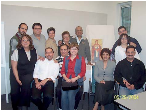
Alberta. Primo ritiro annuale. 29 maggio 2004.